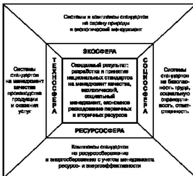
Рисунок 3 — Стратегическая структура четырех главных направлений нормативно-технического обеспечения устойчивого развития организаций

- менеджмент энергоэффективности, структура стратегического распределения которых приведена на рисунке 3.