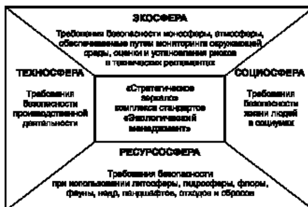
Рисунок 4 — Структура стратегического охвата направлений нормативного регулирования в сфере экологической безопасности