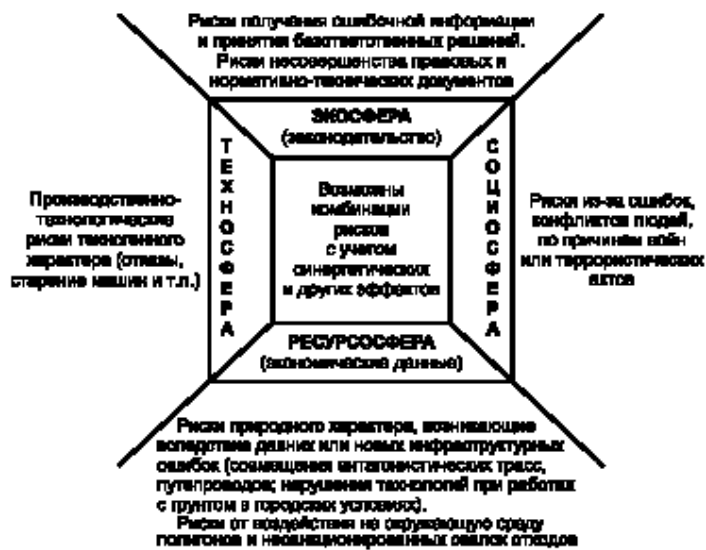
Рисунок А.1 — Стратегическая классификация экологических рисков